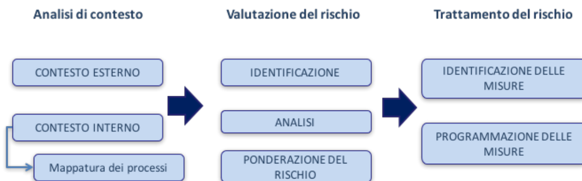
Figura 1: Le principali fasi del processo di gestione del rischio (Determinazione ANAC n. 12 del 28 ottobre 2015)

Rispetto alle aree di rischio, il PNA prima e l'aggiornamento 2015 al PNA poi, hanno fornito una lista di aree, denominate "aree generali", rispetto alle quali ciascuna amministrazione deve valutare il livello di esposizione al rischio, tenuto conto del fatto che generalmente sono aree presenti in tutte le amministrazioni e che per le caratteristiche delle attività che ricomprendono sono generalmente esposte al rischio di corruzione. Per il settore sanità queste aree sono: